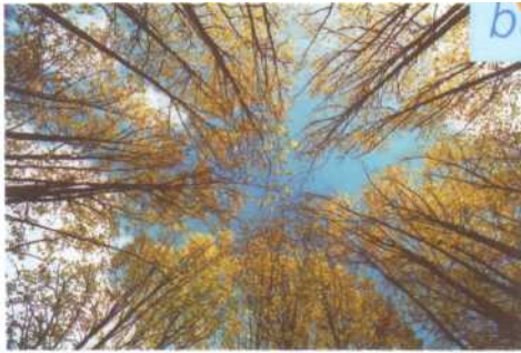
Bäume: Einzigartige Geschöpfe der Natur

Nähe des Chiemsees eine wunderschöne, prächtig blühende Kastanie – freistehend, so dass sie sich nach allen Seiten hin entwickeln konnte. Weil das Licht aber nicht stimmte, kam der Fotograf noch einmal wieder, um dem Baum mit einem Foto die Ehre zu geben. Wer also nicht dazu kommt, unter einem echten Baum zu träumen, erfährt vielleicht beim Betrachten der Fotografien einige Minuten Ruhe und Kontemplation.